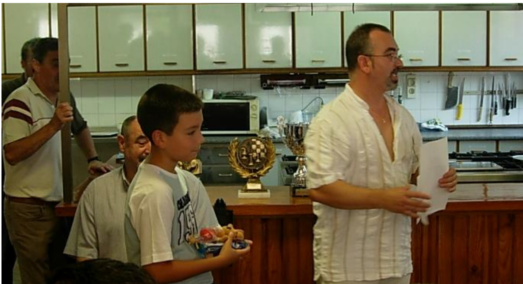
La Sociedad Ajedrecística Logroñesa también aporta jóvenes valores.