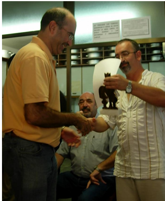
El capi de la S.A. Logroñesa