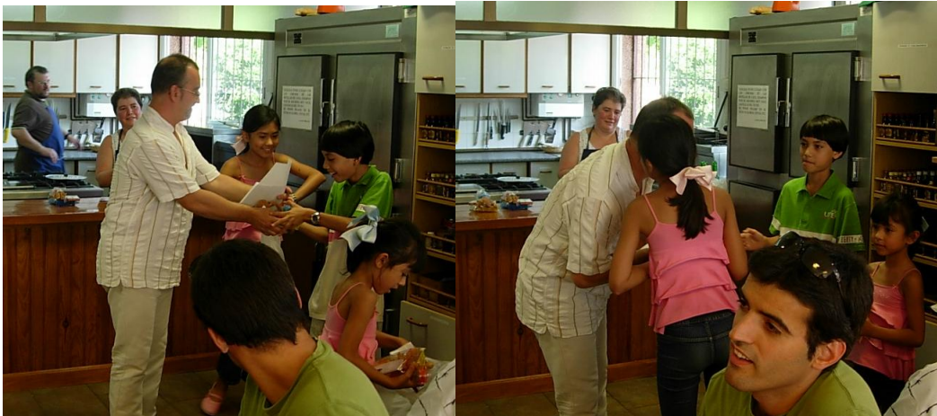
Los jóvenes jugadores de la familia Espinosa en representación de Sestao